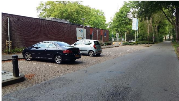
“Kiss and ride” zone