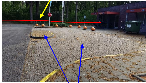
Bidons en kleding kinderen